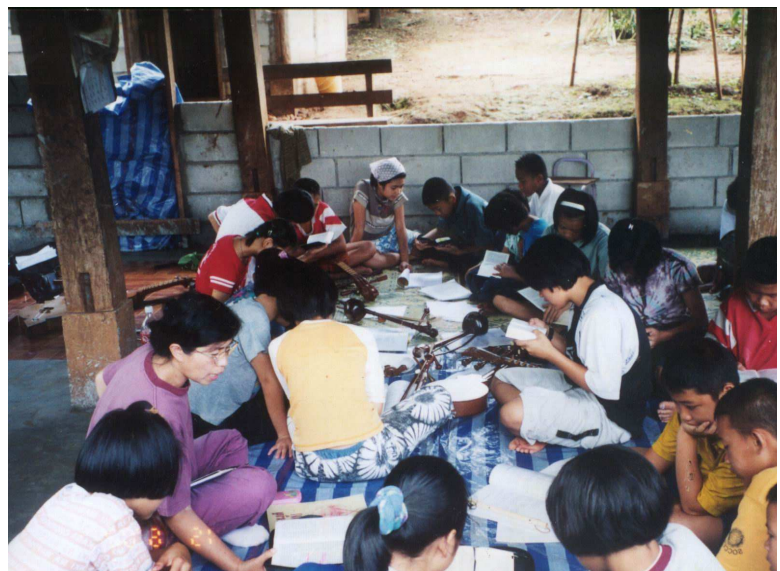
Personas tai estudiando la Biblia durante una clase de música.