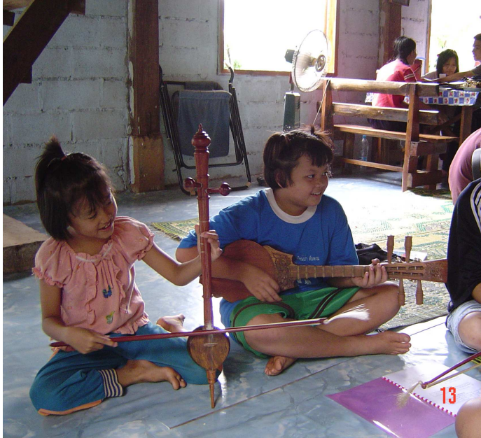
Niños tocando el Sa Laa (un instrumento tipo violín hecho de coco) y el Seung (la guitarra).

Ambas regiones de Tailandia, al norte y noreste, tienen sus propias tradiciones musicales y sus propios instrumentos. El enseñar música ayuda a desarrollar la creatividad de los niños y les da un sentido de logro. Ellos también pueden aprender a escribir sus propias canciones para alabar a Dios.