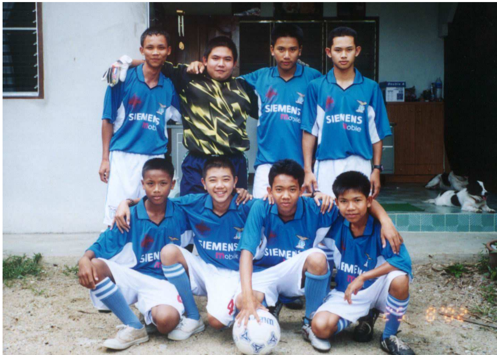
Miembros del equipo de fútbol en Tailandia.

Desafortunadamente, las drogas también son un problema muy grande en Tailandia y al involucrar a los niños en los deportes es una manera de ayudarles a que cuando crezcan y sean tentados al uso de las drogas se alejen de ellas.