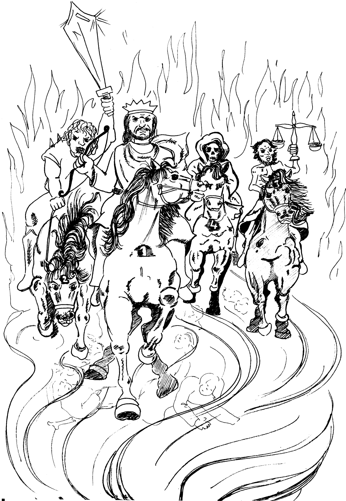
ILUSTRACIÓN (D.12.4.6) LOS CUATRO CABALLOS DE APOCALIPSIS