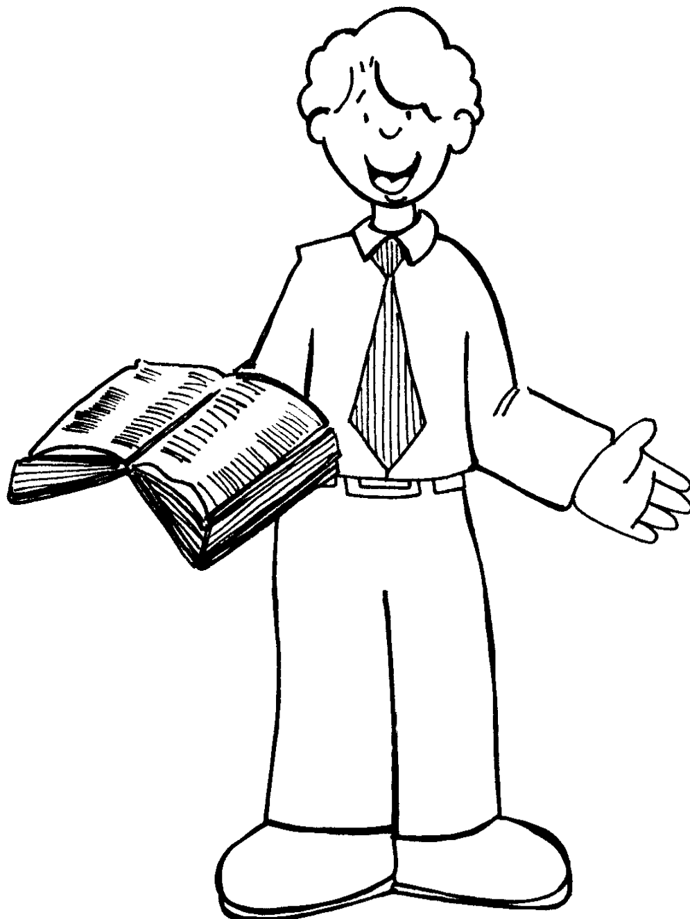
ILUSTRACIÓN (A.3.4.13) COMPARTIENDO LA PALABRA DE DIOS

"Si alguno quiere servirme, que me siga..." (Juan 12:26a)