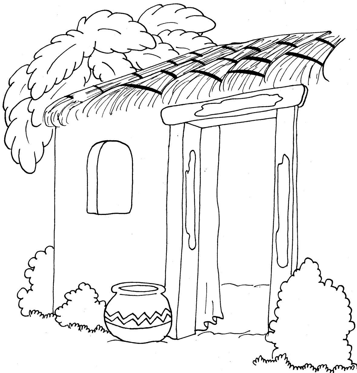
ILUSTRACIÓN (B.6.3.5) CASA ISRAELITA CON SANGRE EN LA PUERTA