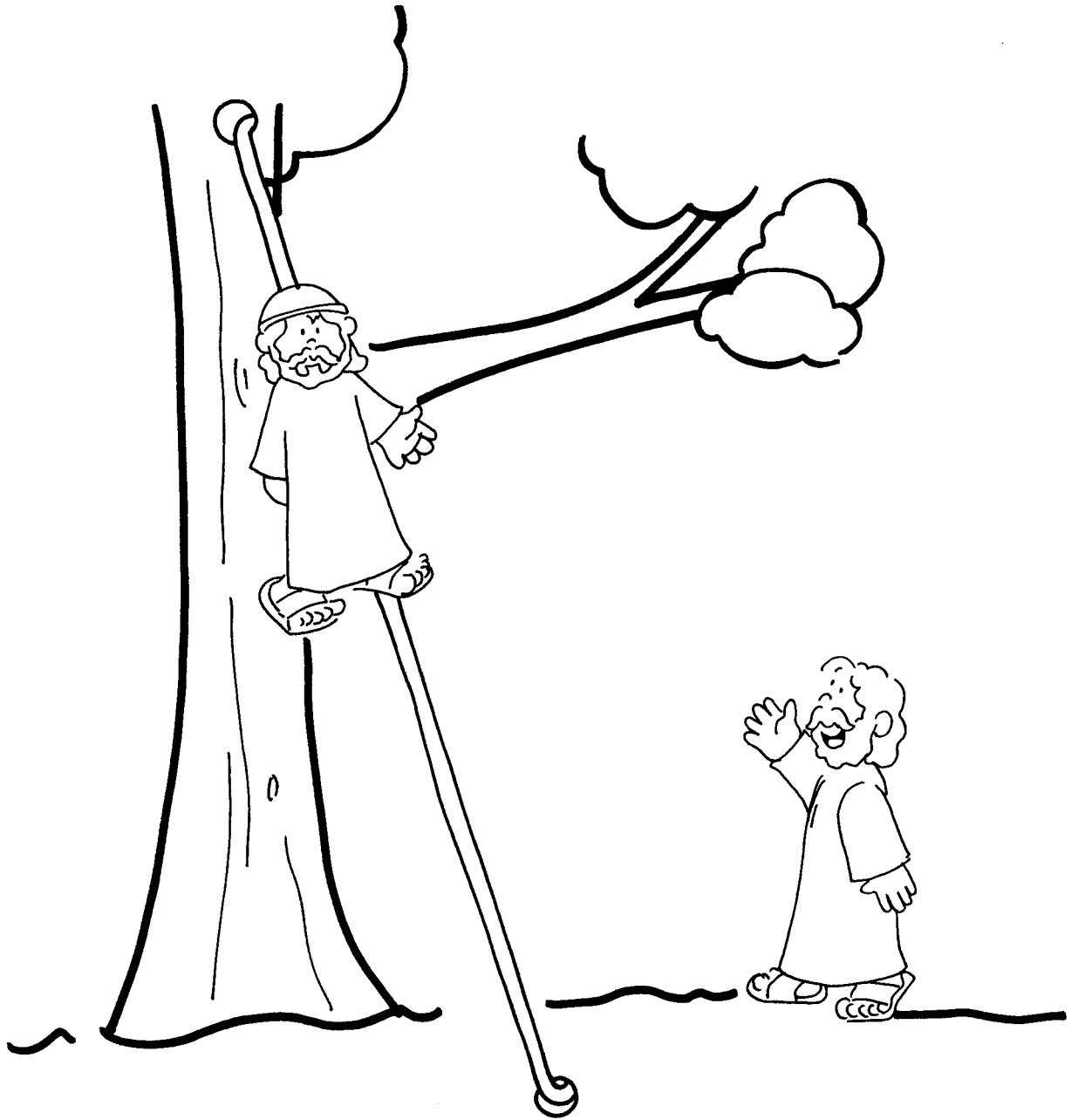
ILUSTRACIÓN DE LA MANUALIDAD (A.2.3.12)