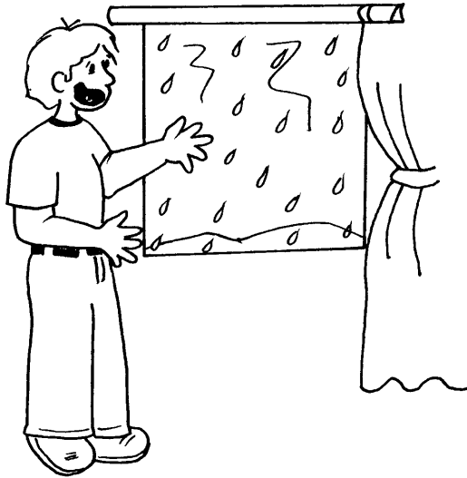
ILUSTRACIÓN (B.4.2.11) SITUACIONES QUE ME PRODUCEN TEMOR